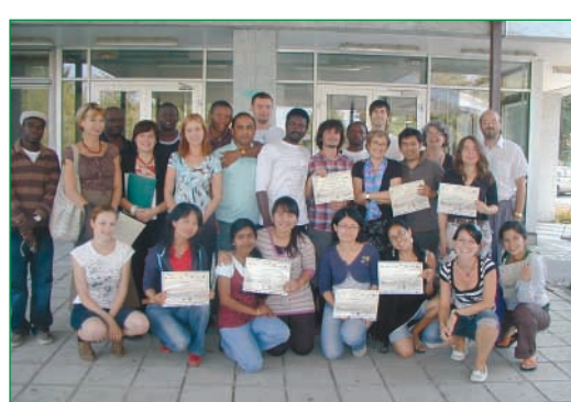
Úspešný projekt vyvrcholil odovzdaním certifikátov. Bodku urobilo foto na pamiatku...

padovej štúdie medzinárodnou asociáciou ICA (Association for European Life Science Universities) v Berlíne,