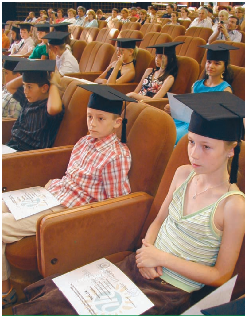
Držať v rukách diplom, to je túžba každého študenta univerzity. Tento sen sa nedávno splnil malým vysokoškolákom, ktorí absolvovali prázdninovú Nitriansku letnú univerzitu. Aj keď na ten skutočný diplom si budú musieť ešte niekoľko rokov počkať... Čítajte na 3. strane!