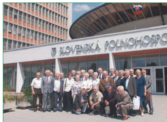
Prišli si zaspomínať na roky študentské i tie nedávno minulé. Absolventi z roku 1958... Foto: za