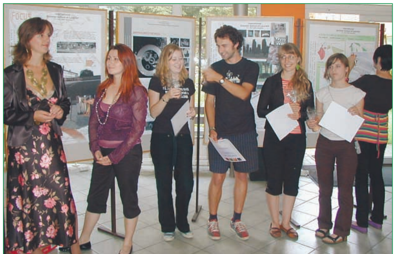
Letnú školu uzavrela slávnostná vernisáž, na ktorej študenti prezentovali svoje diela.