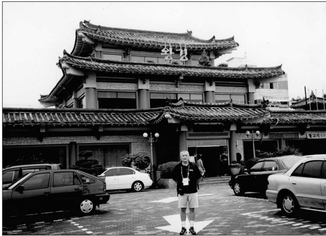
V nekonečnom zástupe železiarskych obchodov, kovošrotov a predajní áut sme v centre Daegu objavili aj veľmi „moderne vybavenú“ pagodu.

pretkávané šesť až osemprúdovými bulvármi. Jazdia na nich neskutočné autá strednej a vyššej triedy, ktoré boli našim štvrtým šokom. Až na malé výnimky sú však nositeľmi len troch značiek. Kia, Hyundai a Daewoo. Modely, ktoré tam prevládajú, sme však u nás nevideli. Všetko sú to napodobeniny - od mercedesov, cez alfa romeo až po BMW. Z cudzích značiek sa predávajú a jazdia len najdrahšie americké autá (aj Daewoo patrí do GM klubu) a Volvo. Pri priemernom plate takmer 2500 USD a pri cene auta okolo 16 000 USD za kategóriu vyššej strednej triedy sú prístupné každému. Jednoducho, výrobky zo železa alebo kože tu nemajú veľkú hodnotu. A naopak, za ručne vyrábané predmety z dreva či iného prírodného materiálu pomaly nevedia čo zapýtať!