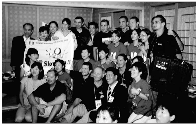
Časť slovenskej akademickej výpravy s kórejským „fan klubom“.