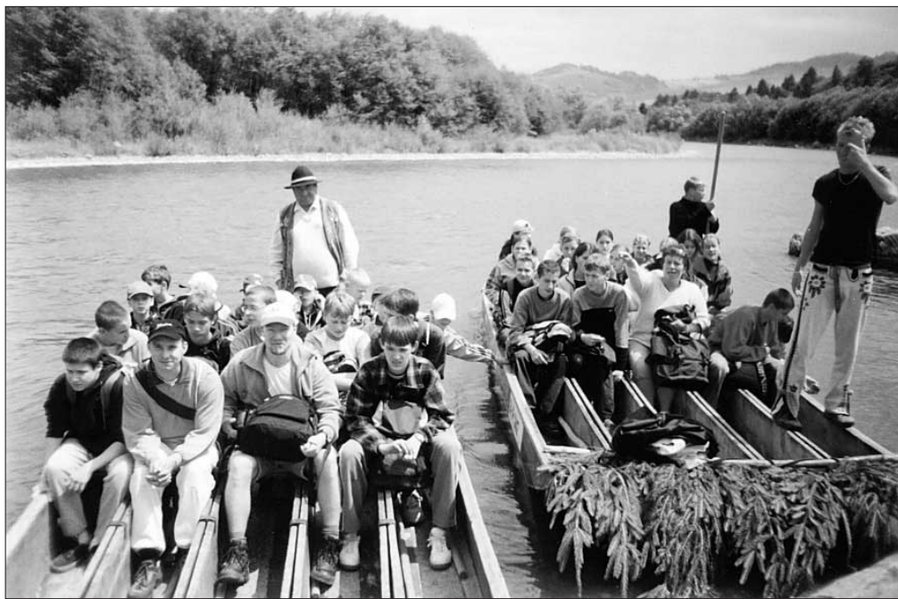
Zážitkom pre viac ako osemdesiat detí zamestnancov SPU, ktoré sa v júli zúčastnili na letnej škole v prírode v Račkovej doline, bol aj výlet do Pieninského národného parku a plavba plťou po Dunaji.