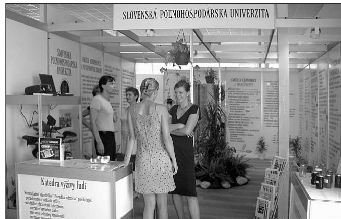
Nechýbala ani poradňa racionálneho stravovania, ktorú pripravila Katedra výživy ľudí.