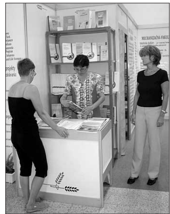
Súčasťou našej expozície na veľtrhu Agrokomplex 2003 bol už tradične predaj odbornej a vedeckej literatúry.

Už po druhý raz sa v pavilóne K na pôdiu Agrofóra organizovaného Agroinštitútom v Nitre vystriedali mnohí odborníci s prednáškami z najrôznejších odvetví poľnohospodárstva a potravinárstva, medzi nimi i naši zamest-