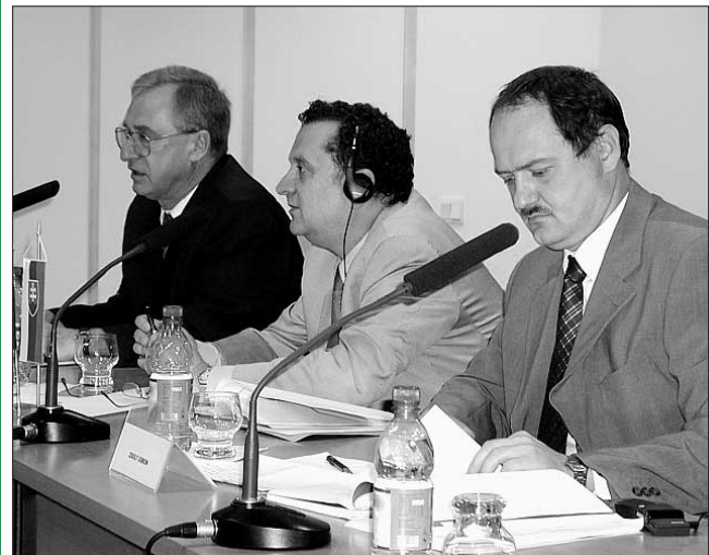
V diskusii sa S. Rodriguez (v strede) a Zs. Simon vyjadrili aj k oblasti dotačnej politiky EÚ.

▲ V kongresovom centre SPU sa 11. júla konal seminár organizovaný MP SR, Misiou Slovenskej republiky pri európskych spoločenstvách v Bruseli a našou univerzitou. Generálny riaditeľ sekcie poľnohospodárstva EÚ J. M. Silva Rodriguez a minister pôdohospodárstva SR Zsolt Simon informovali na ňom odbornú verejnosť o výsledkoch zasadnutia ministrov pôdohospodárstva súčasných i budúcich členských krajín Európskej únie, ktoré sa týkali reformy Spoločnej poľnohospodárskej politiky EÚ a implementácie jednotnej platby na plochu v nových členských štátoch únie.