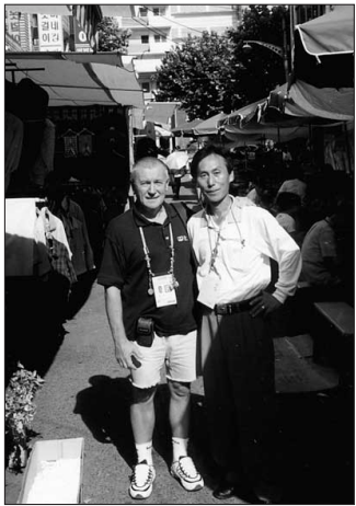
S našim „kápom“ (sprievodcom a vodičom v jednej osobe) na výprave za pravou ázijskou šatkou.

Výstup z priletenej budovy v „malom“ dva a pol miliónovom provinčnom meste Daegu bol šokom číslo dva: 38 stupňov Celzia a takmer stopercentná vlhkosť vzduchu vie človeka zo strednej Európy riadne zaskočí. Ubytovali nás v jednom z „mrakodrapov“ v univerziádnej dedine. Označenie 15-poschodového domu ako mrakodrapu nie je práve najpresnejšie, ale v meste, kde najvyššie budovy nemajú viac ako tri poschodia, je výstižné. Ubytovava-