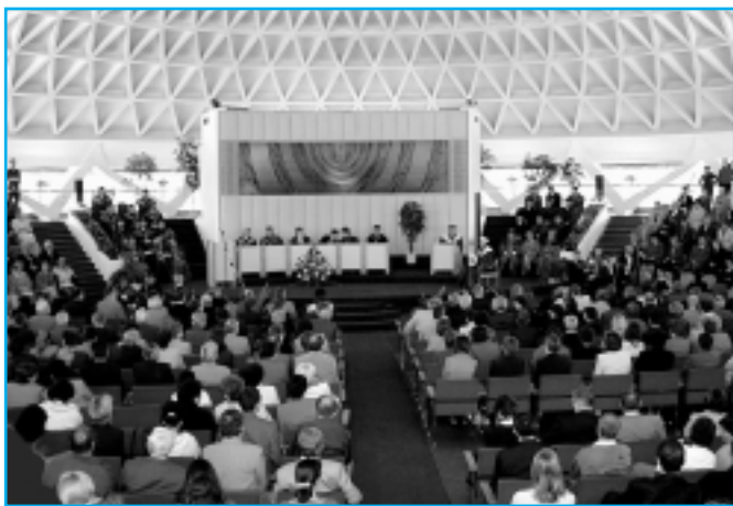
* Za účasti pedagógov, študentov a zamestnancov SPU, hostí zo sesterských univerzít a zástupcov štátnej a verejnej správy sa 20. septembra 2002 v aule SPU slávnostne začal nový akademický rok.