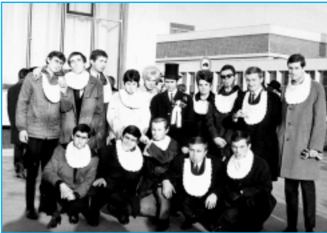
* Imatrikulačná fotka stará tridsať rokov. Sme to skutočne my?