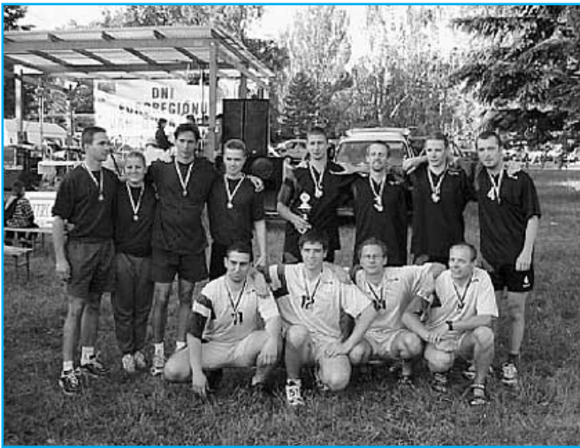
* Víťazné posádky súťaže športových štvorkánoí.