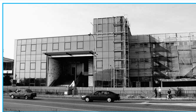
* Rekonštrukcia Slovenskej poľnohospodárskej knižnice by mala byť ukončená v budúcom roku.